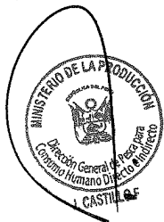
PEDRO C. OLAECHEA ÁLVAREZ-CALDERÓN MINISTRO DE LA PRODUCCIÓN